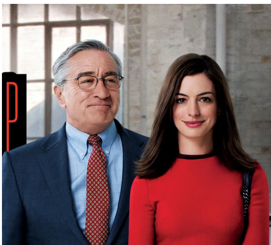
Предлагаем посмотреть стр. 7