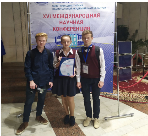
Ученик года стр. 4