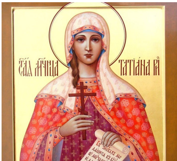
Татьянин День стр. 2

Издаётся с сентября 2006 года • № 04 • mgol.of.by