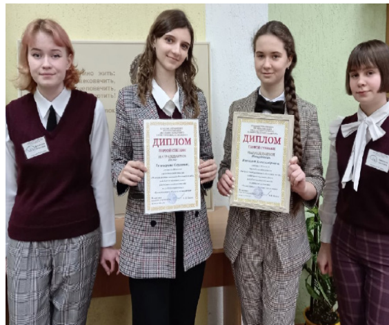
Итоги олимпиады стр. 3