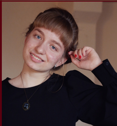
Главный редактор - Елизавета Петрусёва