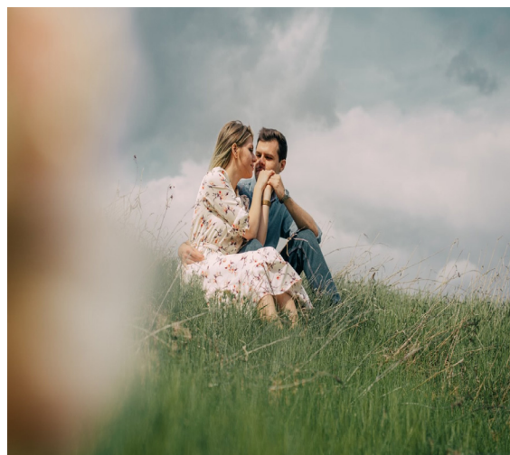
Проба пера стр. 8