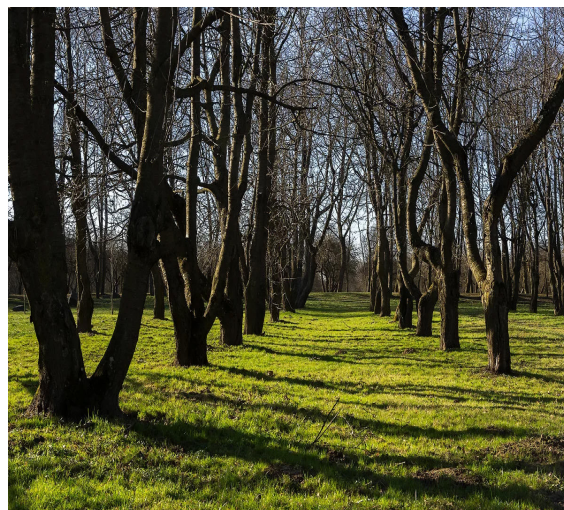
Лошицкий парк стр. 5-6