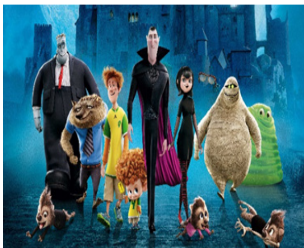
Топ-5 Гарри Поттер стр.6