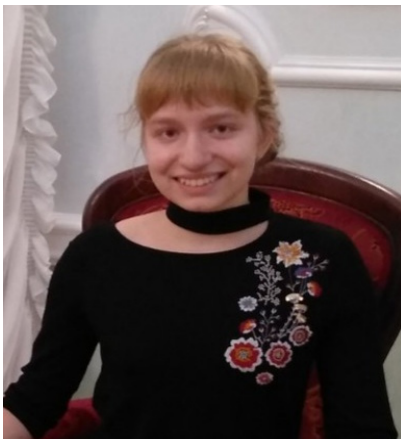
Главный редактор - Петрусёва Елизавета