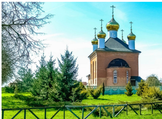
Мая малая Радзіма стр.4

Издаётся с сентября 2006 года • № 02, 2020г. • mgol.of.by