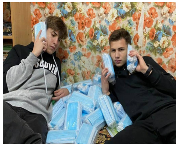
Новые лидеры стр.2