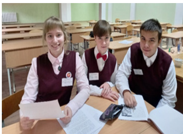
Необычная форма НПК стр.3