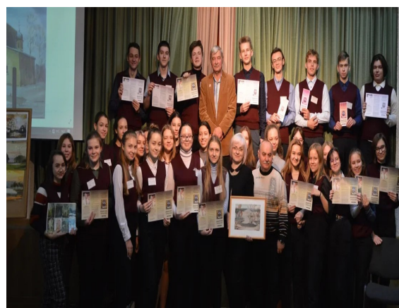
Встреча с художником стр. 5