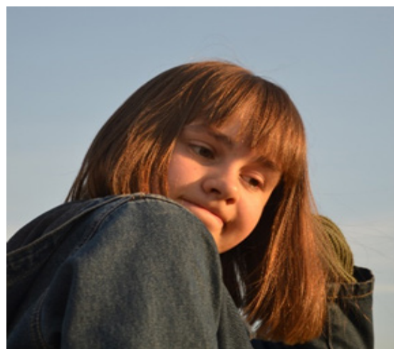
Проба пера стр.7